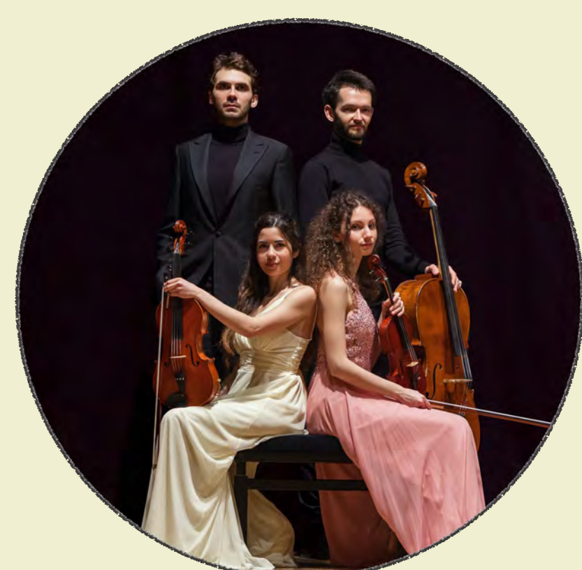
QUARTETTO WERTHER quartetto con pianoforte